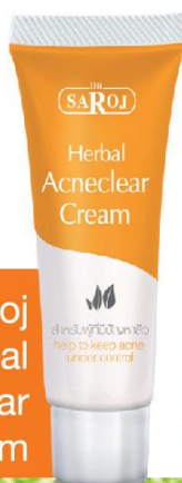
Dr.Saroj Herbal Acneclear Cream