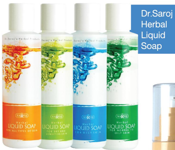
Dr.Saroj Herbal Liquid Soap