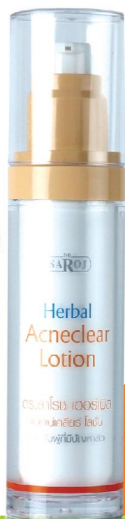
Dr.Saroj Herbal Acneclear Lotion