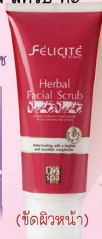
(ขัดผิวหน้า)