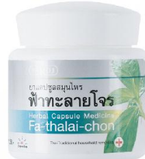
ยาแคปซูลสมุนไพรฟ้าทะลายโจร บรรจุ 80 แคปซูล / ราคา 164 บาท

เป็นสมุนไพรที่ได้รับรองจากองค์การอนามัยโลก (WHO) ว่าช่วยบรรเทาอาการหวัด โดยเฉพาะผู้ที่เป็ นหวัดร้อน (อาการเหงื่อออก กระจายน้ำ ท้องผูก ปัสสาวะ สีเข้ม) แต่จะไม่เหมาะกับผู้ที่เป็ นหวัดเย็นคือมีอาการหนาวสั่น อ้อมอึ้งเท่าเย็น ฟ้าทะลายโจรมีฤทธิในการสร้างภูมิคุ้มกันในร่างกาย ไม่ให้เป็ นหวัดง่าย ช่วยแก้อาการปวดหัวตัวร้อน ทั้งยังแก้ไอ ลดน้ำมูก ขับเสมหะด้วย ปัจจุบันฟ้าทะลายโจรมีแบบแคปซูลที่สามารถรับประทานได้ง่ายขึ้น