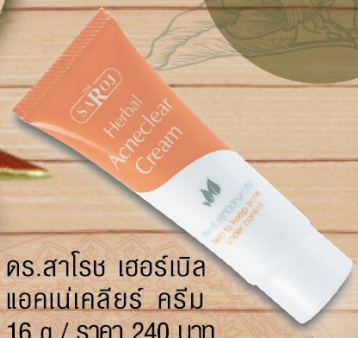
ดร.สาโรช เฮอร์เบิล แอดเนเคลียร์ ครีม 16 g / ราคา 240 บาท