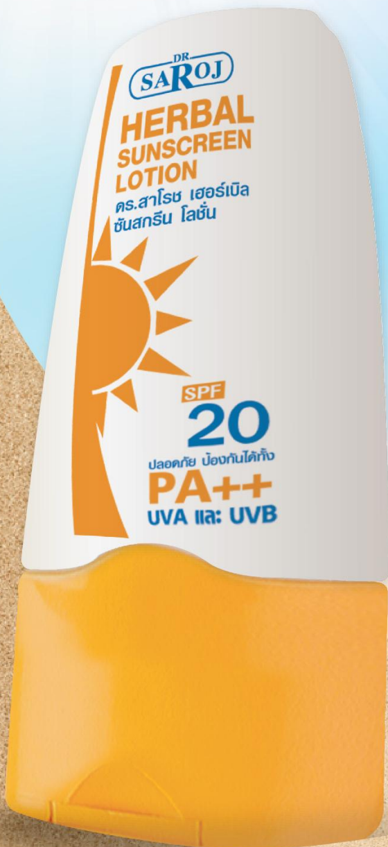
ดร.สาโรช เฮอร์เบิล ซันสกรีน โลชั่น 60 ml / ราคา 260 บาท

ผิวของคนเป็นสิว มีลักษณะผิวที่บอบบาง และอาจจะเกิดการอักเสบได้ง่าย ผลิตภัณฑ์บางชนิดยังเป็นตัวกระตุ้น โดยเฉพาะส่วนผสมที่มีน้ำมันสูง ผู้ที่หน้ามันหรือเป็นสิวง่าย จึงนิยมใช้ผลิตภัณฑ์ประเภท Oil-Free แต่ยังมีปัจจัยอื่นอีกด้วยที่จะทำให้อาการสิวเกิดการอักเสบและอุดตัน ฉะนั้นสุขภาพและความงามฉบับนี้จึงมีเทคนิคการเลือกครีมกันแดด สำหรับคนที่มีปัญหาสิวมามากฝากค่ะ